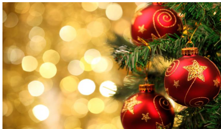
Планы на празднование, траты и подарки

Для себя и членов семьи итоги уходящего года россияне оценивают выше, чем в прошлом году: индекс личных итогов года** в 2018-м составил 17 п. (с 14 п. в 2017-м) . «Хорошим» или «удачным» лично для себя и своей семьи этот год назвали 57%, а 40% сказали, что в их жизни скорее преобладали трудности или год был очень тяжелым. Динамика оценок итогов года в масштабах страны куда менее позитивна: соответствующий индекс демонстрирует спад по сравнению с прошлым годом: с -12 п. до -27 п. Баланс оценок по-прежнему остается отрицательным: 33% респондентов дают позитивные оценки, 60% – негативные. На 2019-й граждане возлагают гораздо меньшие надежды, ожидания перемен к лучшему, чем год назад на 2018-й: индекс личных ожиданий*** от будущего года снизился с 64 п. в 2017 г. до 34 п. в 2018 г. Показатель ожиданий в масштабах страны также значительно снизился (с 42 п. до 3 п.). Каждый пятый респондент (21%) полагают, что год будет удачным для них лично, 13% - для страны в целом.