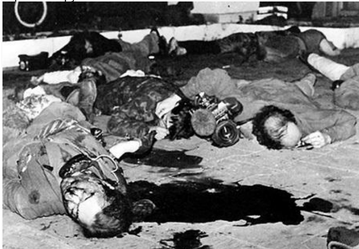
Это фото подтверждает: у «Останкино» косили из пулеметов всех подряд, включая журналистов с камерами

19.45 Телевещание прекратилось. Дорога к телецентру «Останкино» была перекрыта частями дивизии МВД на грузовиках и БТР. Обстреливали даже машины «скорой» и санитаров с носилками. По официальным данным, тут погибли 46 человек. По полученным в ходе независимых расследований - свыше 500. В паузах между огнем живых хватали и куда-то увозили - журналистов в «Матросскую тишину». Раненых добивали. Безоружному мальчишке в казачьей одежде предварительно прострелили руки и ноги