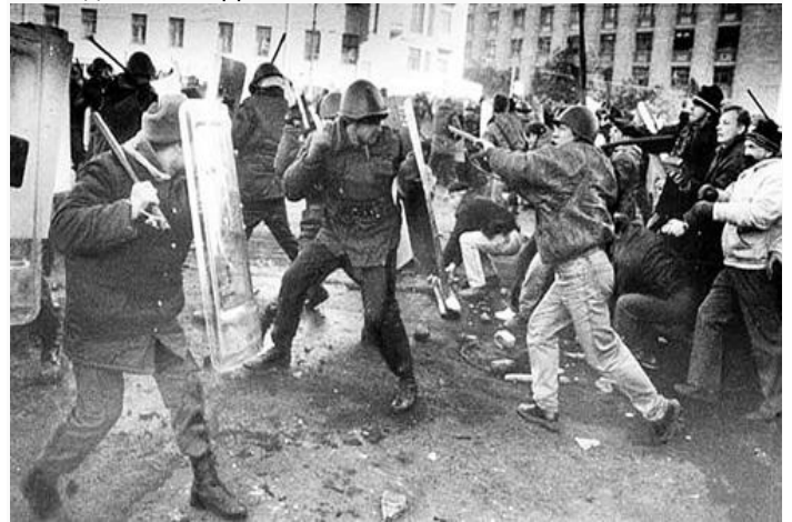
Неравный бой: десятки тысяч москвичей пытались пробиться на помощь осаждённому парламенту

04.30 Началось перемещение войск, техника и сил милиции к Дому Советов. За час были стянуты войска Таманской дивизии, 119-го парашютно-десантного полка, Кантемировской дивизии, дивизии Дзержинского, Смоленского ОМОНа, Тульской дивизии ВДВ.