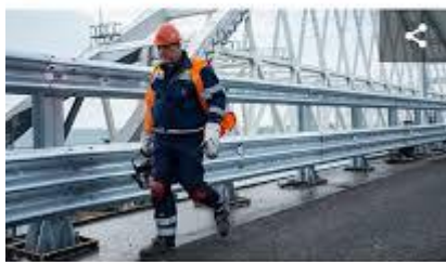
© РИА Новости / Алексей Мильгаво Перейти в фотобанк