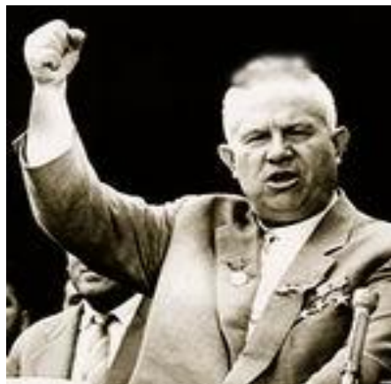
Чья бы корова мычала...