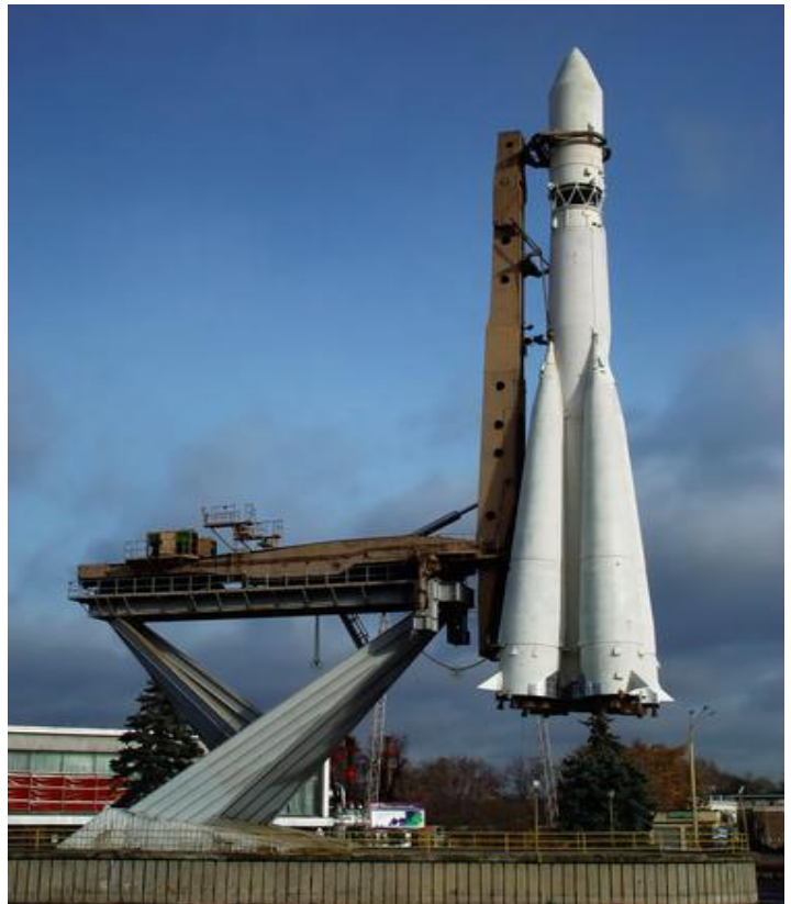
Первый советский космический корабль «Восток»

Тот праздник не формальный во многих странах мира. С недавних пор в России и не только проводится не менее грандиозное событие, посвященное Дню Космонавтики – Юрьева ночь . В темное время суток в рамках альтернативы классических митингов, праздничных программ и выставок она празднуется в формате вечеринок. Основоположниками торжества стали активисты из Америки, волну подхватили неравнодушные поклонники героизма Юрия Александровича Гагарина в разных странах мира. В помещениях ночных клубов устраиваются особые космические программы.