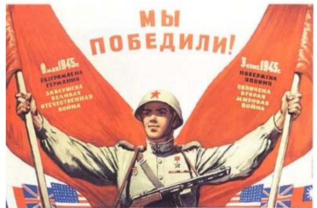
СЛАВА НАШЕМУ ВЕЛИКОМУ НАРОДУ. НАРОДУ-ПОБЕДИТЕЛЮ!

За рубежом День Победы отмечается на 9, а 8 мая. Это связано с тем, что акт о капитуляции был подписан по центрально европейскому времени 8 мая 45-го года в 22 часа 43 минуты. Когда в Москве с ее двух часовой разницей во времени, уже наступило 9 мая. Истерзанная войной Европа тоже отмечала День Победы искренне и всенародно. 9 мая 1945 года почти во всех европейских городах люди поздравляли друг друга и солдат - победителей. Например, в Лондоне центром торжеств