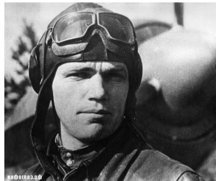
Иван Никитович Кожедуб

Когда напряжение боя спало, настроение у меня было совсем не победным — я ведь уже успел разглядеть белые звёзды на крыльях и фюзеляжах. «Устроит мне... по первое число» — думал я, сажая машину. Но всё обошлось. В кабине «Мустанга», приземлившегося на нашей территории, сидел здоровенный негр. На вопрос подоспевших к нему ребят, кто его сбил (вернее, когда этот вопрос смогли перевести) он отвечал: «Фокке-Вульф» с красным носом. Когда проявили плёнки ФКП, главные моменты боя оказались зафиксированы на них очень чётко. Командир дивизии Савицкий, в оперативное подчинение которому